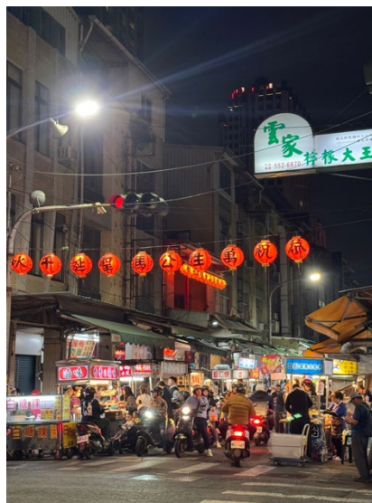
退勤時間帯のバイク