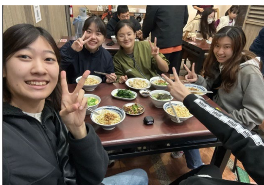
台湾学生4人と最後の夜ご飯

この経験を通して、留学当初と比べて中国語能力が大きく向上しただけでなく、困難な状況に直面した際に、自ら課題を分析し、行動によって解決していく力を身につけることができました。本留学経験で培った主体性と問題解決力を、今後の学業や進路に生かしていきたいと考えています。