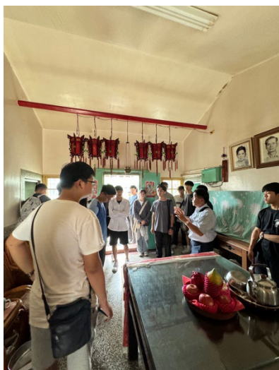
フィールドワークの様子

外国で授業を受けることは、言語面や文化理解の面で困難を感じることも多くありましたが、周囲の学生や先生方と良好な関係を築くことで、不安を軽減し、前向きに学ぶことができました。日本以外の国で授業を受けることで、同じ内容を学んでいても、新たな視点や発見が得られると実感しました。留学先では語学習得のみにとらわれるのではなく、現地でき学べない知識や価値観を大切に、積極的に理解しようとする姿勢が重要であると感じました。