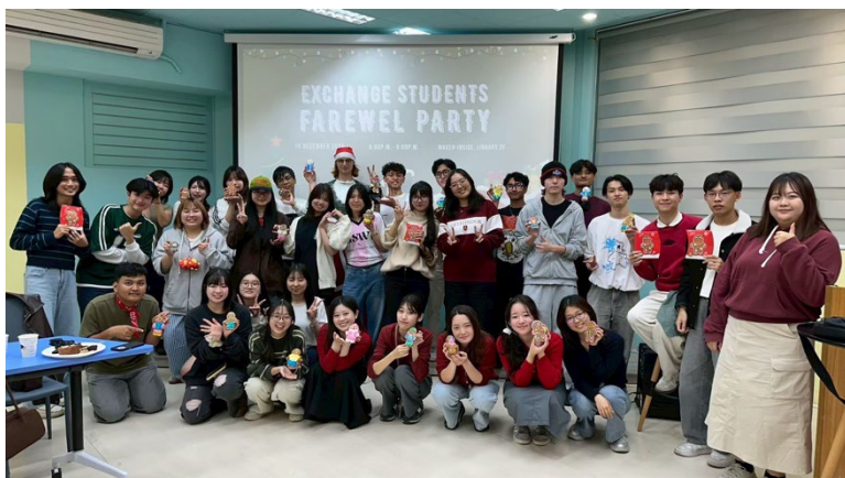
同じ学期に留学した交換留学生の仲間とバディの台湾学生