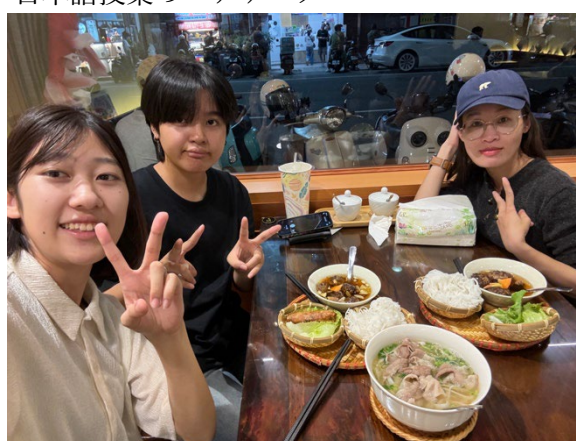
ベトナムの友人と人生初のベトナム料理