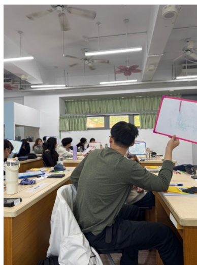
日本語授業のペアワーク