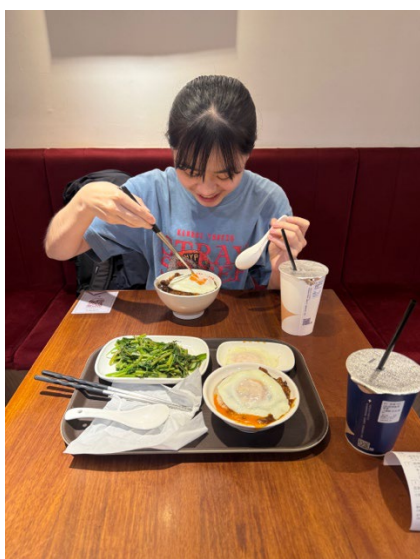
台湾のソウルフード「ルーローハン」